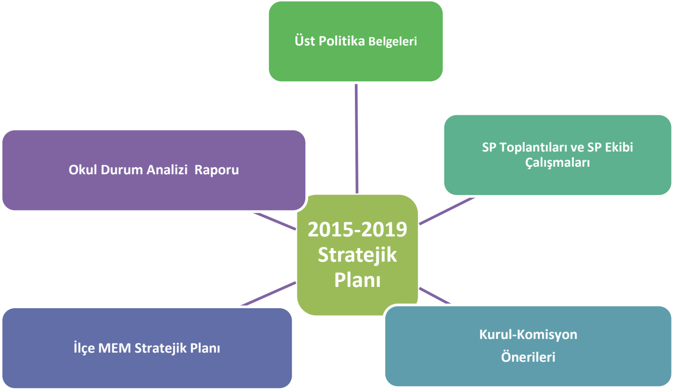
Şekil 1: Stratejik Plan (SP) Oluşum Şeması